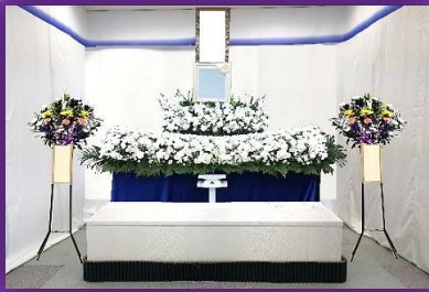
祭壇はイメージです