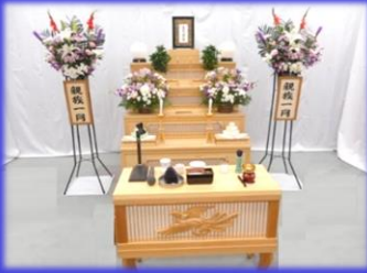
祭壇はイメージです